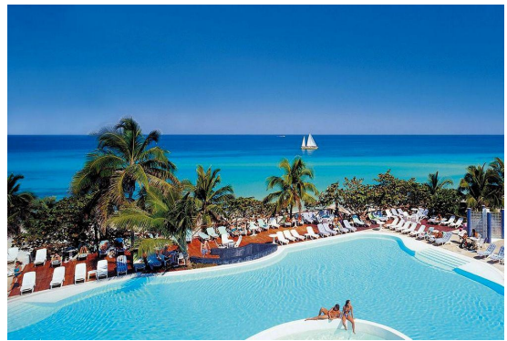
3、尽享美丽海滩：有着“象牙粉”之称的古巴风情海滩巴拉德罗，阳光明媚，海水清澈，白沙细软。