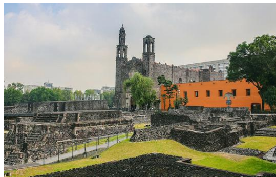
Colonia del Sacramento

1、首都之城：墨西哥合众国的首都墨西哥城，海拔2240米，是世界第二大城市。古巴首都哈瓦那，有“加勒比海的明珠”之称，吸引着来自世界各地的游客。