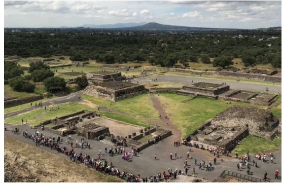
2、探索玛雅文明：世界文化遗产特奥蒂瓦坎古城与媲美埃及金字塔的日月金字塔。