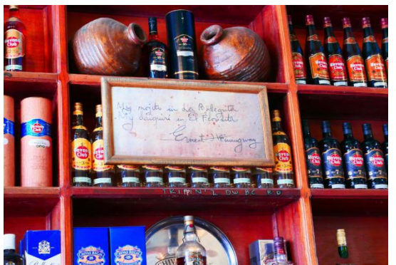
5、打卡哈瓦那老城网红餐厅-五分钱小酒馆，海明威生前最爱的酒馆。